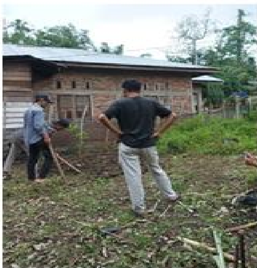
Gambar 2. Pembersihan lahan