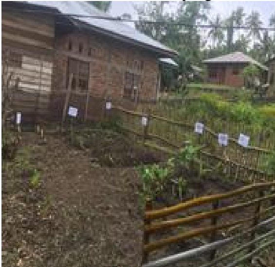
Gambar 7. Apotek hidup yang dikembangkan warga.