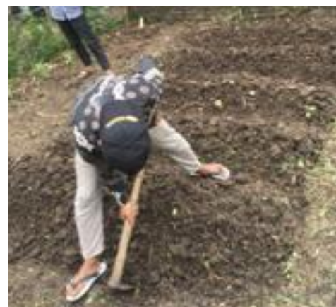
Gambar 4. Pembuatan Bedengan