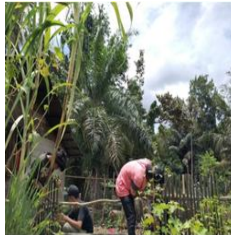
Gambar 3. Pembuatan pagar apotek hidup